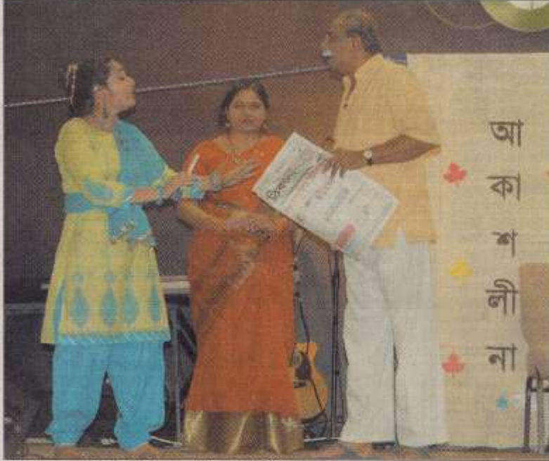
লুব্ধিয়ানা : তাড়াটিয়া চাই নাটকের একটি দৃশ্য। ছবি-ঠিকানা।

অবস্থা থেকে পরিমাণ লাভ করতে সক্ষমিত উদ্যোগের বিকল্প নেই। জনাব রব বলেন, আমাদেরকে অবশ্যই এদেশে জীবিত রচনার উদ্যোগকে অগ্রাধিকার দিতে হবে। দিচ্ছেন ভবিষ্যত যে যত (বাঁকী অংশ ৬৫ পাতায়)