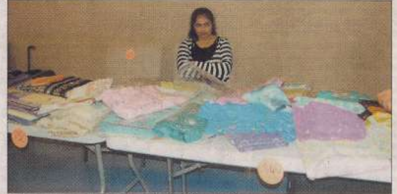
লুব্ধিয়ানা : সাহিত্য ও সাংস্কৃতিক সমাবেশে কাগড়ের ষ্টল। ছবি-ঠিকানা।