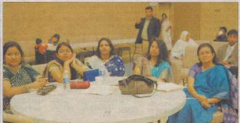
শুকিয়ানা ৷ সাহিত্য ও সাংস্কৃতিক সমাবেশে সৃষ্টির একাংশ। ছবি-ঠিকানা।