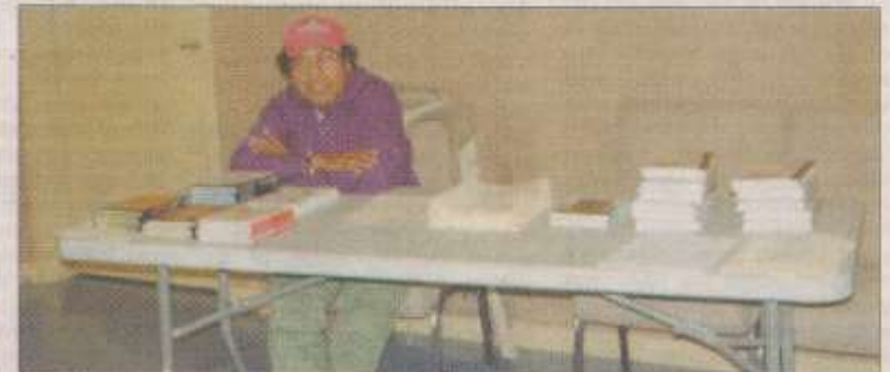
লুব্ধিয়ানা : সাহিত্য ও সাংস্কৃতিক সমাবেশে বই-এর ষ্টল। ছবি-ঠিকানা।