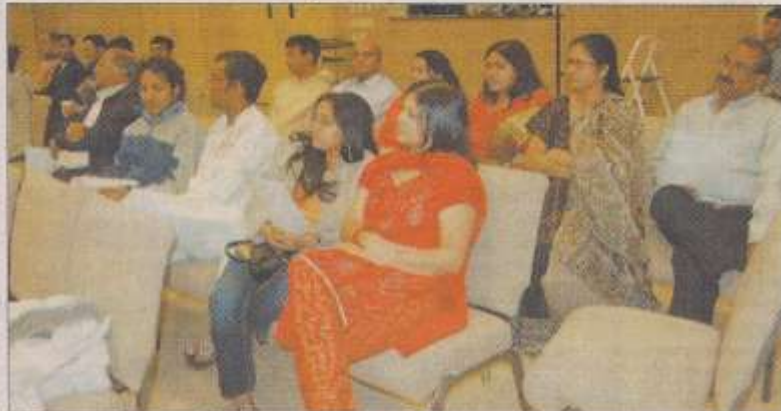
লুব্ধিয়ানা : সাহিত্য ও সাংস্কৃতিক সমাবেশের একাংশ। ছবি-ঠিকানা।