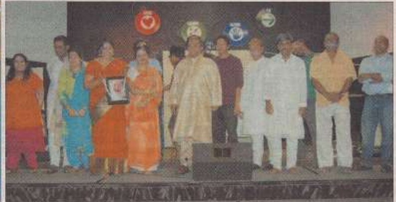
শুকিয়ানা ৷ সাহিত্য ও সাংস্কৃতিক সমাবেশে ভাড়াটে চাই নাটকের অভিনেতা-অভিনেত্রীবৃন্দ। ছবি-ঠিকানা।