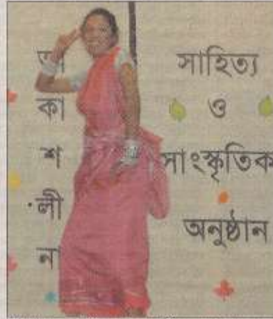
পুঝিয়ানা ঃ সাহিত্য ও সাংস্কৃতিক সমাবেশে মৃত্তা সুমাহিতা। ছবি-ঠিকানা।