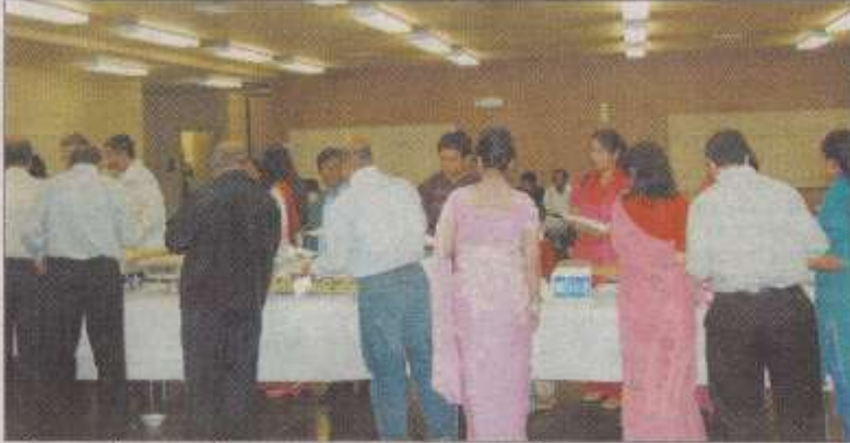
শুকিয়ানা ৷ সাহিত্য ও সাংস্কৃতিক সমাবেশে খাদ্য গ্রহণের শাইন। ছবি-ঠিকানা।