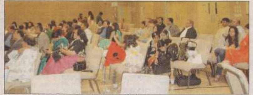
লুব্ধিয়ানা : সাহিত্য ও সাংস্কৃতিক সমাবেশের একাংশ।