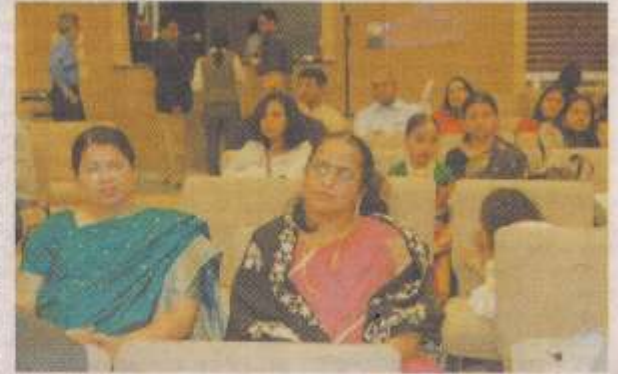
পুঝিয়ানা ঃ সাহিত্য ও সাংস্কৃতিক সমাবেশের প্রকাশে।